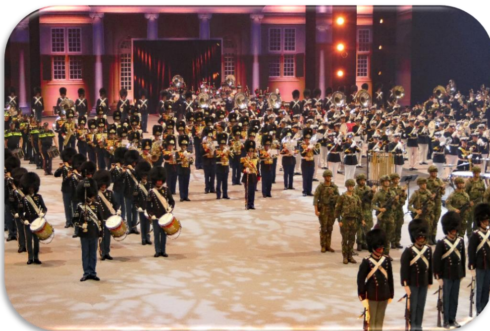
Vereniging van Vrienden Koninklijke Militaire Kapel 'Johan Willem Friso' (KMKJWF) Regimentsfanfare 'Garde Grenadiers en Jagers' (RFGGJ)

Wij zien uw aanmeldingen met belangstelling tegemoet!